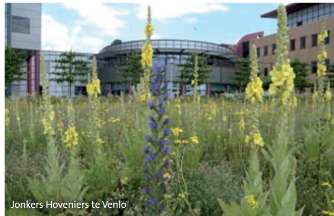
Jonkers Hoveniers te Venlo